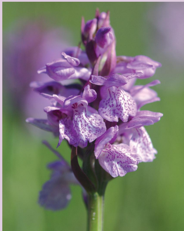
Blütenstand der Torfmoos-Fingerwurz

Die Torfmoos-Fingerwurz wurde erst verhältnismäßig spät als eigene Art beschrieben. Vermutlich ist diese Art auch erst in jüngerer Zeit entstanden. Im Jahr 1927 erschien die Erstbeschreibung des Autors Hans Höppner, der dafür Pflanzen aus Nordrhein-Westfalen zugrunde legte. Er hielt die Torfmoos-Fingerwurz damals für